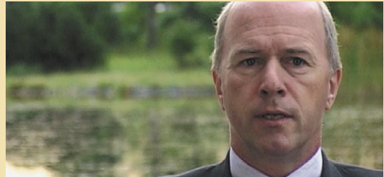
Carl-Peter Forster, President, General Motors Europe

«Don't make change management too theoretical, make it practical!»